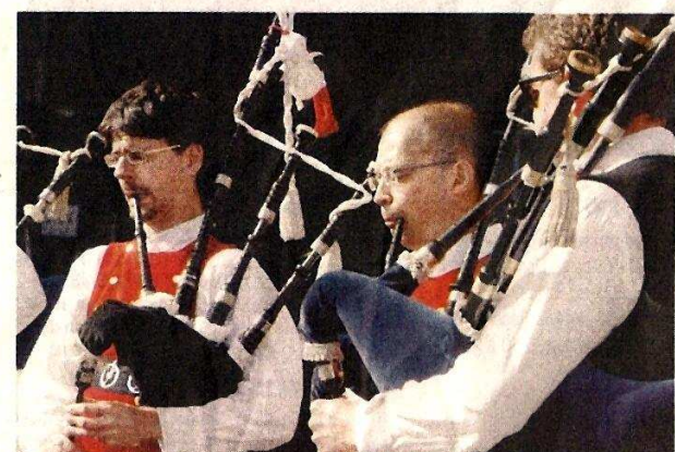
C'est aussi le rendez-vous du folklore européen.