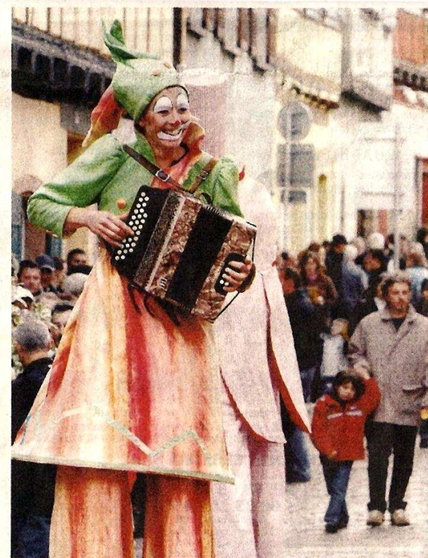
Les animations présentes tout au long de l'après-midi dans les rues.