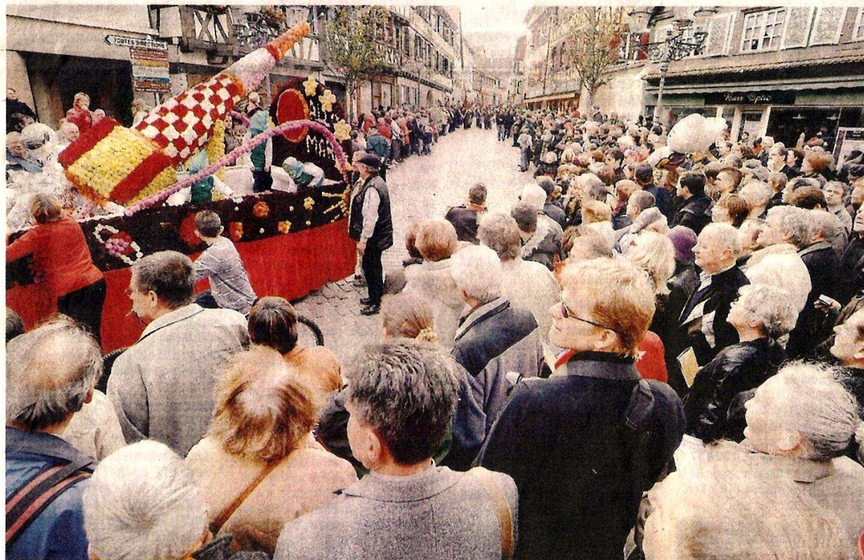
Au total, plus de 30 chars et groupes pour une fête qui attire chaque année quelque 10 000 visiteurs.