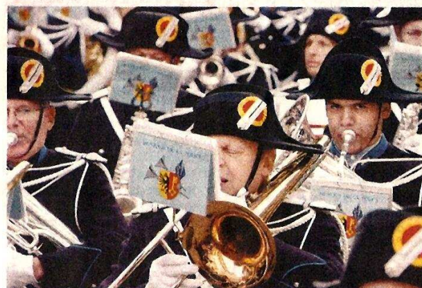
Invitée d'honneur, la musique de la police de Genève.